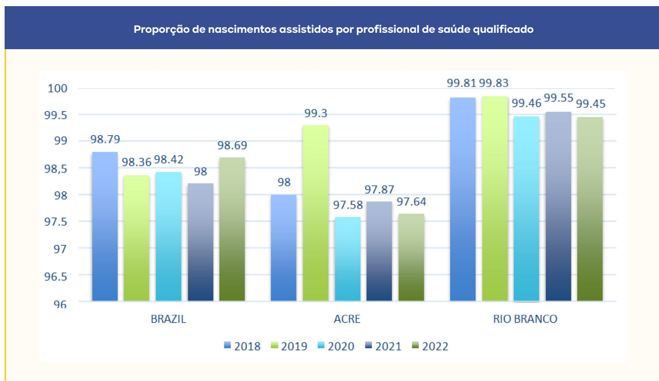
Gráfico 3 - Proporção de nascimentos assistidos por profissional de saúde qualificado, no Brasil, estado do Acre e em Rio Branco, nos anos de 2018-2022

Fonte: Elaborado pelos autores a partir dos dados do Sistema de Informação em Saúde para Atenção Básica – Sisab (2024).